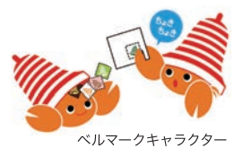
ベルマークキャラクター

「佐竹台市民ホール」はベルマークの取 集場所に登録しています。集めていた だき、お届けいただけますと幸いです。 ※佐竹台小学校でも集めています。