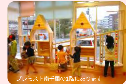
プレミスト南千里の1階にあります

第1・3木曜日の14時30分～16時30分は佐竹台地区の育児サークルさんに貸し出せますのでお問合せください。