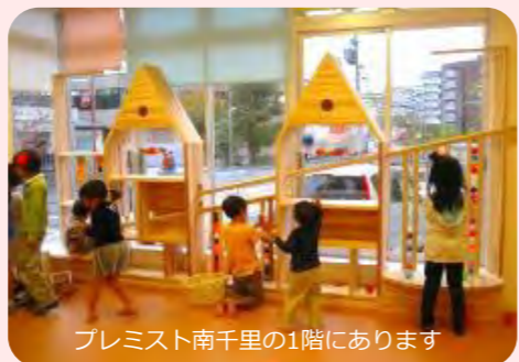
プレミス南千里の1階にあります

①おひさまひろば、②おひさまルーム、③ともにおひさまルームで開催しています。空調・子どもトイレ完備、クッキングフロアのお部屋でのびのび遊べます。