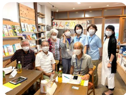
地域包括センターさん、自治会、ボランティアの皆さんとの地域福祉の打合せを経て「ひろばで体操」が実施となりました。