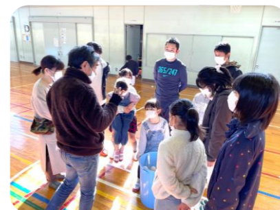
「たまたま運動会」は中止となりましたが、地域の有志の方の協力を得て、次年度に向けて、新しいたまたまの方法を検討していただきました。