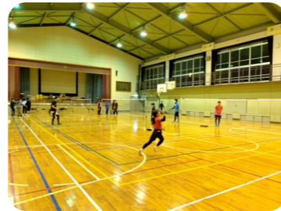
「バドミントンを楽しもう！」の様子