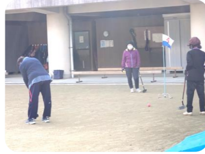
「グラウンドゴルフ体験会」の様子