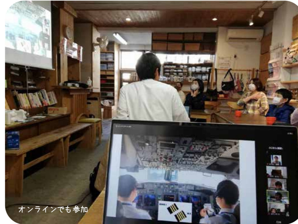
オンラインでも参加